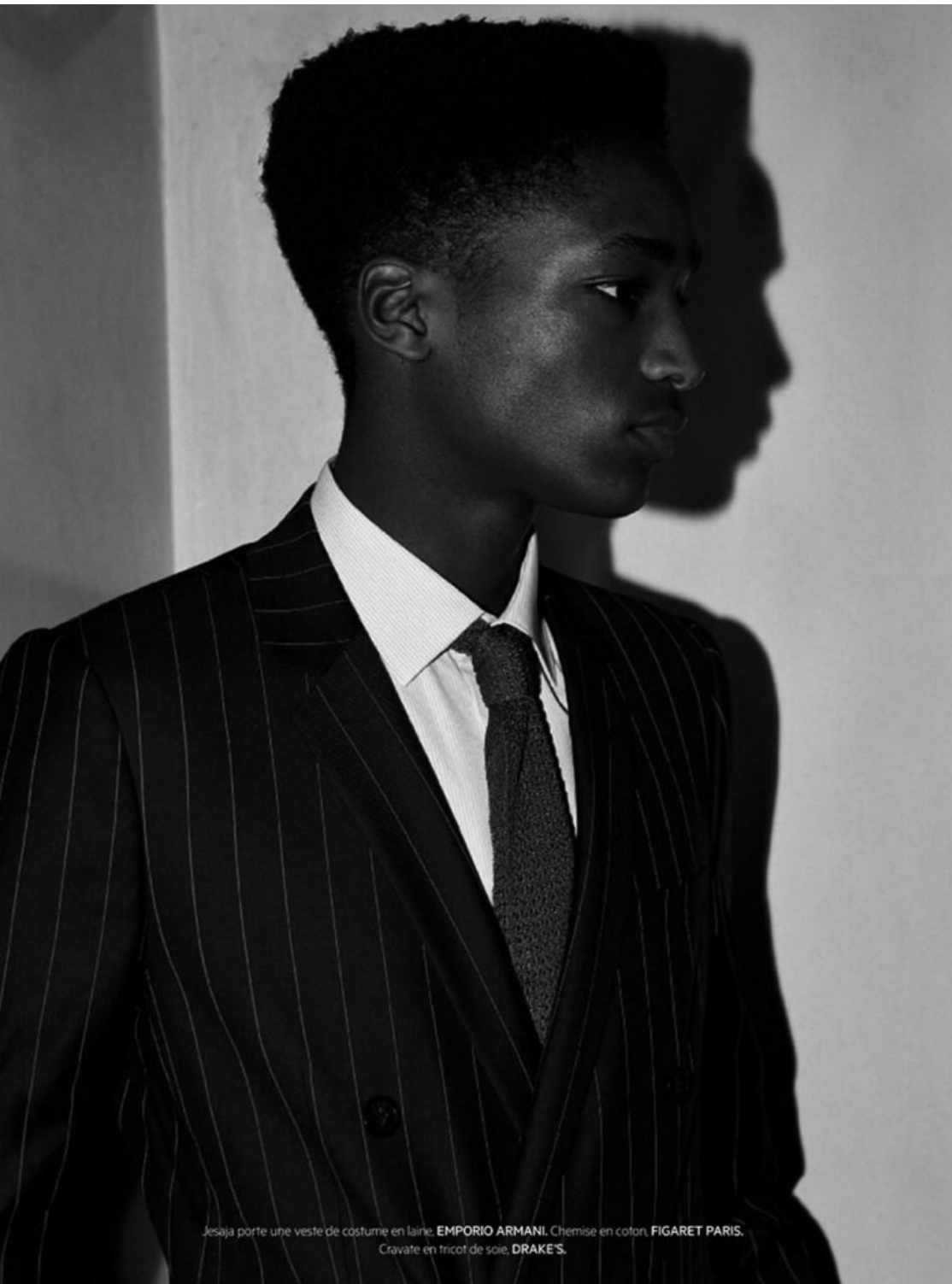
Jesaja porte une veste de costume en laine, EMPORIO ARMANI . Chemise en coton, FIGARET PARIS . Cravate en tricot de soie, DRAKE'S .