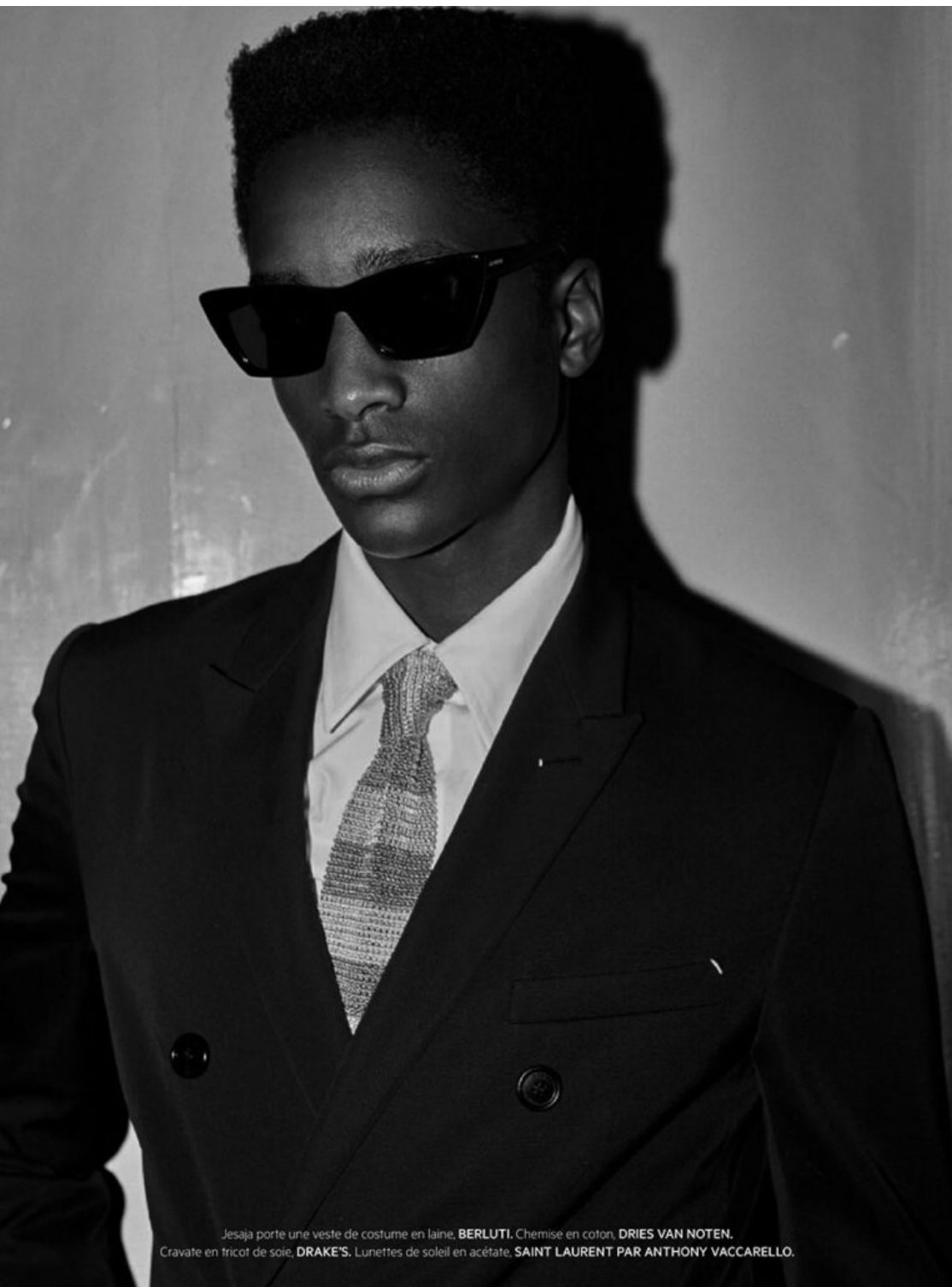
Jesaja porte une veste de costume en laine, BERLUTI . Chemise en coton, DRIES VAN NOTEN . Cravate en tricot de soie, DRAKE'S . Lunettes de soleil en acétate, SAINT LAURENT PAR ANTHONY VACCARELLO .