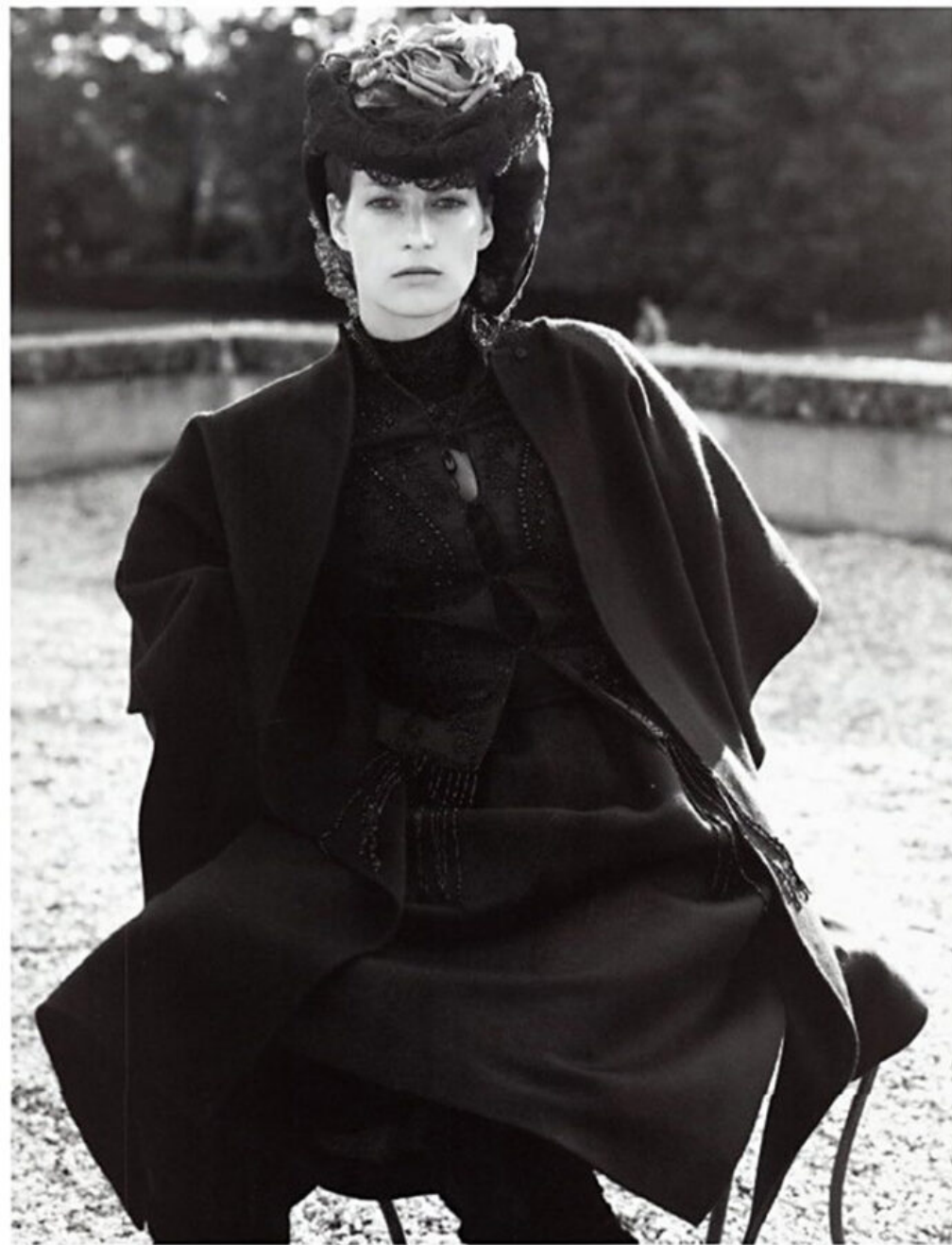
Cappa di cashmere, Mila Schön; gilet Ultraozbek; top Maurizio Pecoraro; gonna Louis Vuitton. Hat Ellen Christine. Nella pagina accanto, da sinistra.