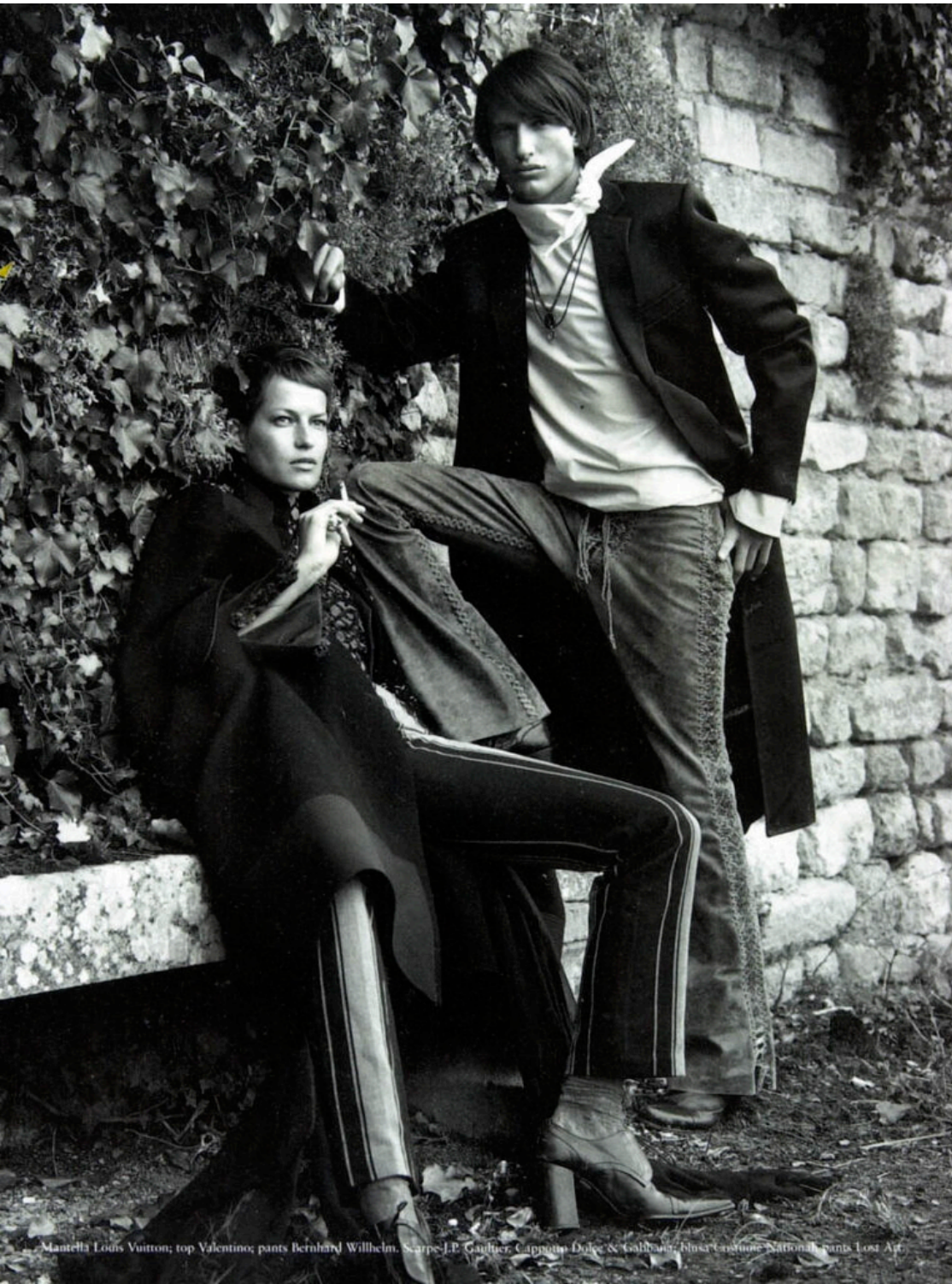
Mantelli Louis Vuitton; top Valentino; pants Bernhard Willhelm; Scarpe J.P. Gaultier; Cappotto Dolce & Gabbana; blusa Christiane National; pants Lost Art