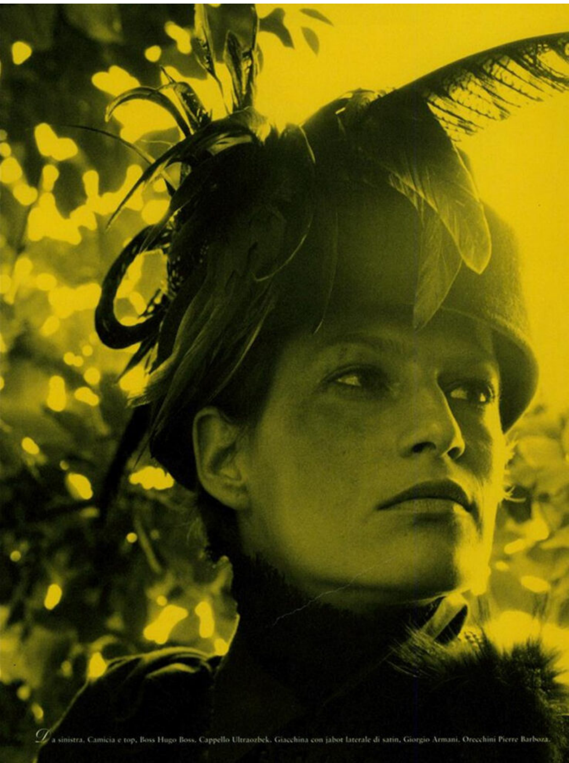
Da sinistra. Camicia e top, Boss Hugo Boss. Cappello Ultraozbek. Giacchina con jabot laterale di satin, Giorgio Armani. Orecchini Pierre Barboza.