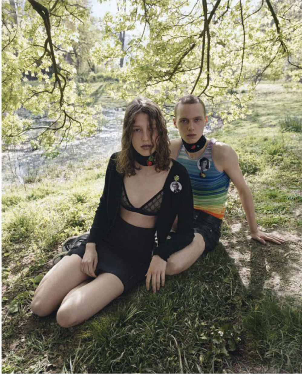
CARDIGAN DI CASHMERE E GONNA DI LANA E SETA, VERSACE; REGGISENO DI TULLE, GUCCI VIA MYTHERESA. CANOTTIERA DI COTONE E SETA E SHORTS DI PELLE, LUDOVIC DE SAINT SERNIN.